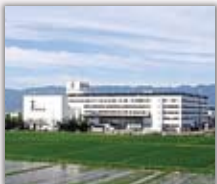
未来工業(株) 岐阜同友会

未来工業(株)は後発のメーカーとして勝ち抜くために、工夫を重ねて商品を様々な差別化。その結果、主力のスイッチボックスは80%のシェアに至る。社員のヤル気を引き出す経営にも注力。年間休日140日余、独自の提案制度など様々な実践。1991年に名証二部上場。特徴ある経営の取り組みは多数のメディアで紹介が続く。2011年第1回「日本でいちばん大切にしたい会社大賞」の大賞を受賞。こうした企業づくりの実践を見学や報告で学んでいきます。